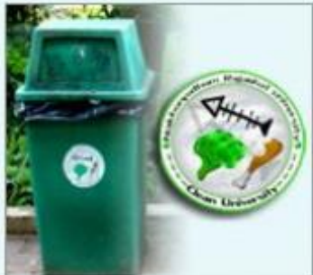
ถังขยะที่ย่อยสลายได้