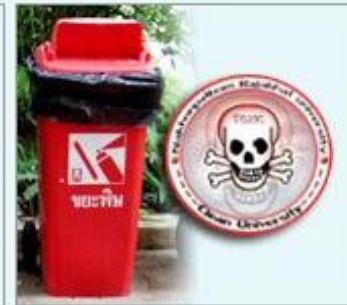
ถังขยะที่เป็นพิษ

4. ขยะพิษ ที่ต้องเก็บรวบรวมแล้วนำไปกำจัดอย่างถูกวิธี เช่น กระจ่างยาฆ่าแมลง หลอดไฟ ถ่านไฟฉาย อุปกรณ์ทางการแพทย์