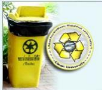
ถังขยะที่สามารถนำกลับมาใช้ได้